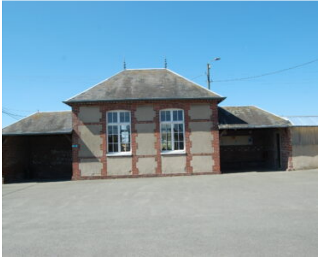
Salle du Tilleul