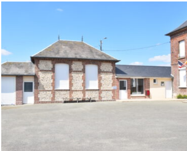
Salle du Tilleul