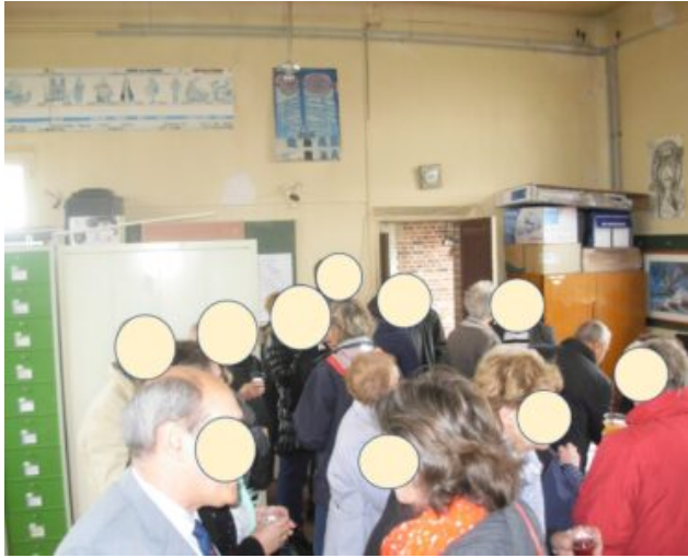
Salle du Tilleul