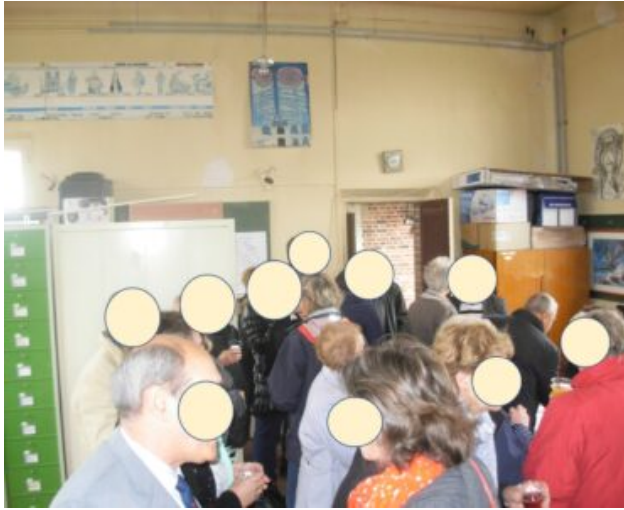
Salle du Tilleul