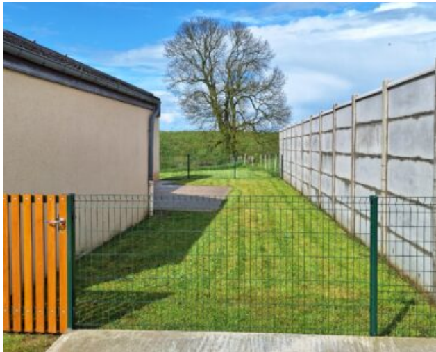
Salle Michel de Decker