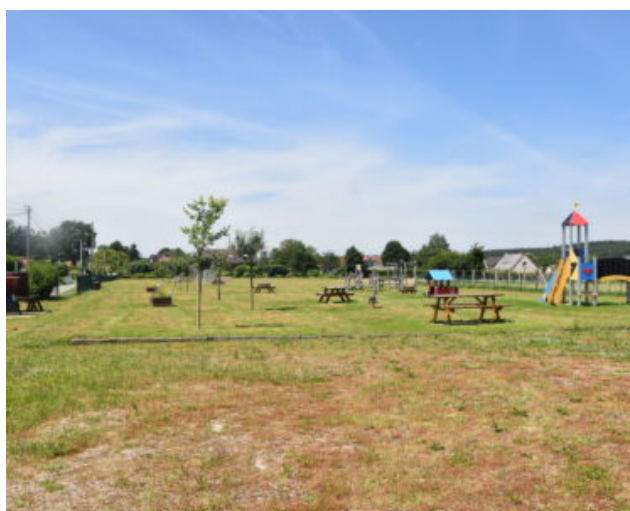
Aire de loisirs