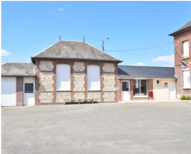
Salle du Tilleul