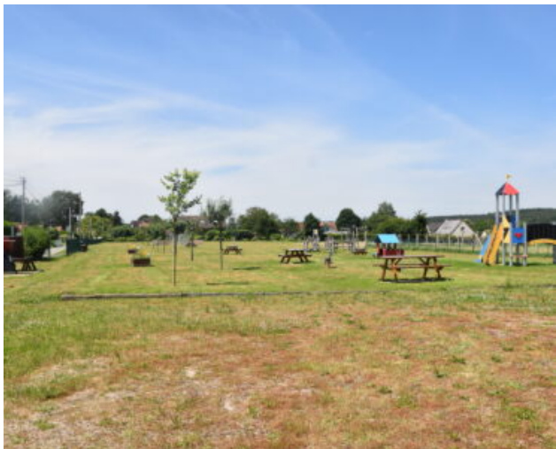
Aire de loisirs