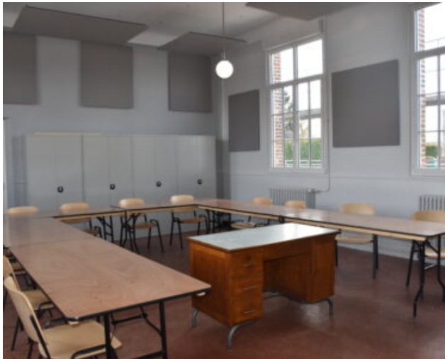
Salle du Tilleul