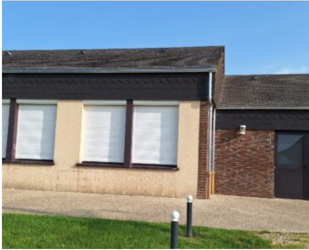
Salle Michel de Decker